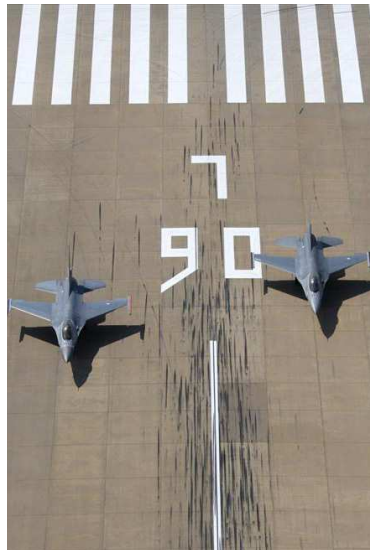
Overgang naar de Omgevingswet | Eindrapportage