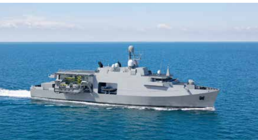
Het nieuw te bouwen MCMV. (Artist impression: Naval Group)