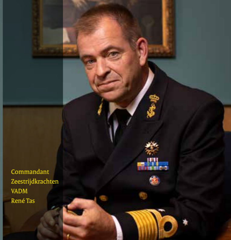
Commandant Zeestrijdkrachten VADM René Tas

VADM Tas – “De situatie in Oekraïne bevestigt dat we met onze vernieuwingen het juiste pad zijn ingeslagen. Ook is het duidelijk dat afschrikking en geruststellende maatregelen geen luxe zijn. We werken daar met onze NAVO-bondgenoten intensiever aan dan voorheen. Dat betekent ook dat schepen langer op zee zijn en de paraatheid hoger is. Zoals gezegd: belangrijk dat we als Europa ook buiten het NAVO-verdragsgebied opereren. De oorlog in Oekraïne is niet zomaar een lokaal conflict. Ik zie het ook als een