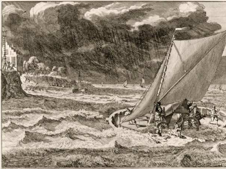
Johan Willem Friso, Prins van Oranje en de Nassau, met een paard en wagen, te Utrecht, 16. 14. 1711.

Ten slotte is er de naamgever van het regiment, prins Johan Willem Friso van Nassau-Dietz (1687-1711), die net als Rennenberg de functie van stadhouder van de noordelijke gewesten bekleedde. Deze telg van de Friese tak van de Nassaus was stadhouder van Friesland, Groningen en Drenthe van 1696 tot zijn dood in 1711. Na het overlijden van de kinderloze koning-stadhouder Willem III in 1702 erfde hij de titel Prins van Oranje. Het Koninklijk Huis stamt rechtstreeks van hem af. Johan Willem Friso voelde zich al vroeg geroepen tot het militaire vak. Hij bezat zelf een cavalerie- en een infanterieregiment (deze regimenten heetten beide Nassau-Friesland – later Oranje-Friesland – maar zijn geen stamonderdeel van het huidige regiment).