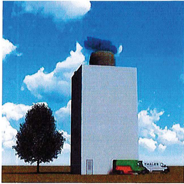
Impressie toekomstige situatie